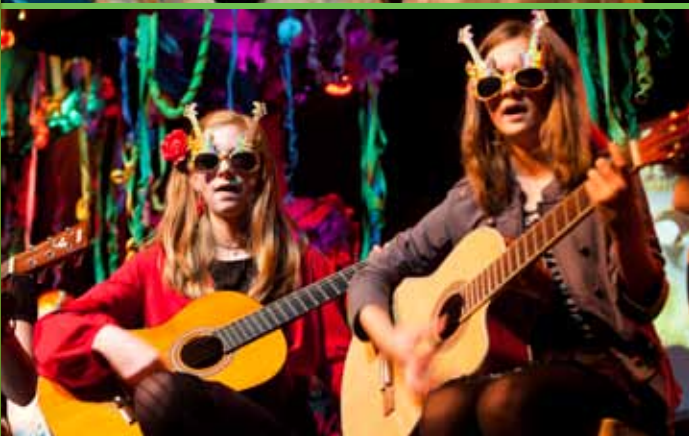
Concerts de Musique 'carnaval'